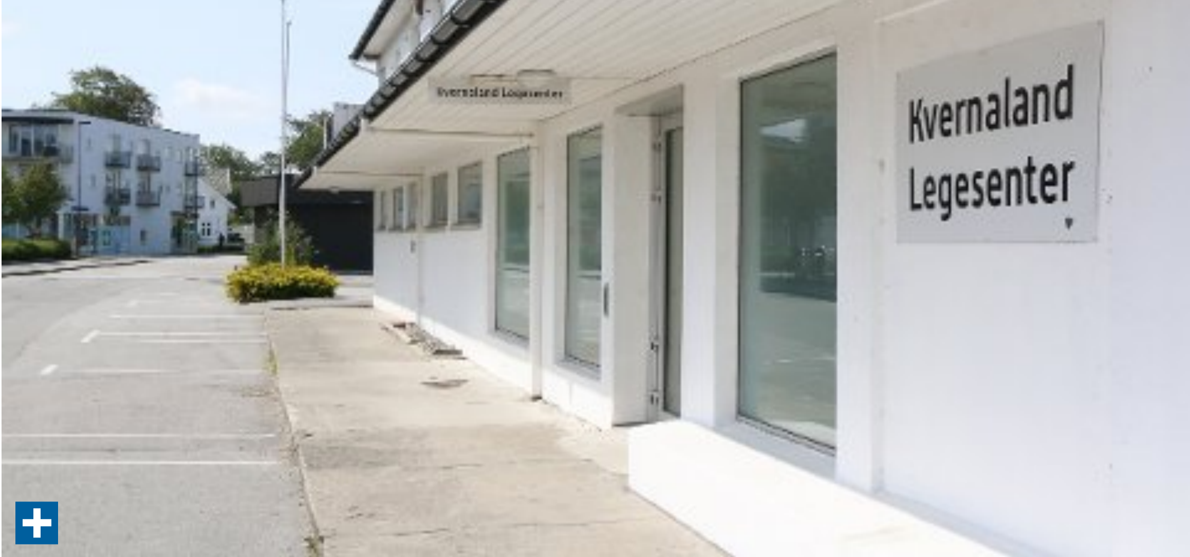
Kvernaland legesenter vil gjera eit uvanleg skifte