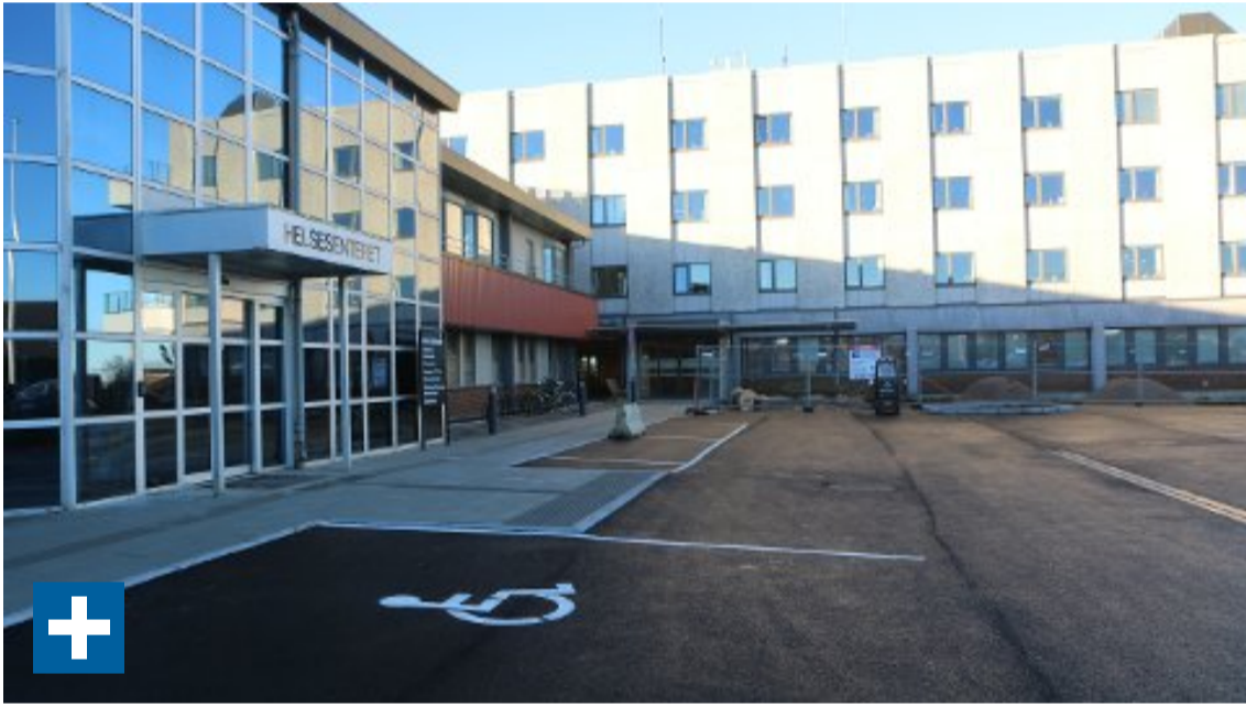
Vil du ha fastlege i Hå? Det går ikkje